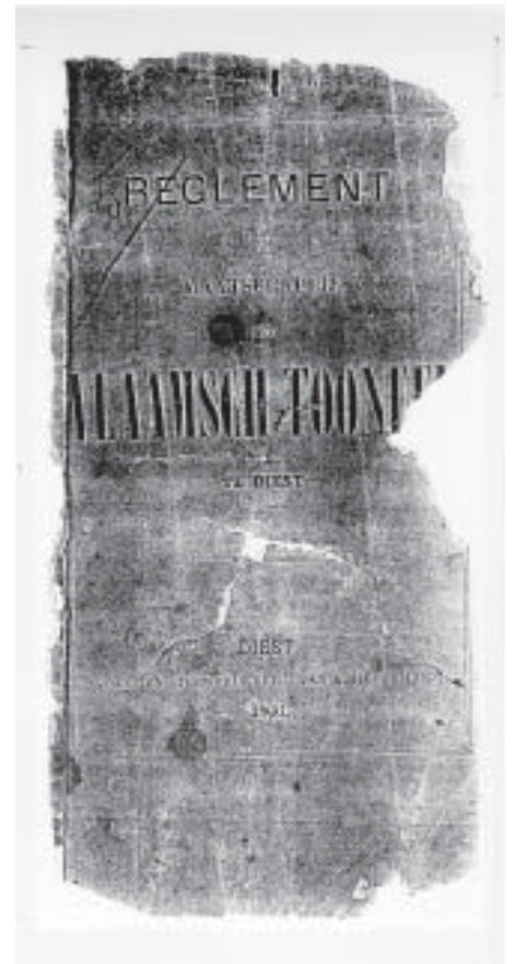
De voorpagina van het “versleten” reglement uit 1866.

Opmerkelijk is ook artikel 18 dat voorschreef dat de leden in alle vergaderingen Nederlands moesten spreken.