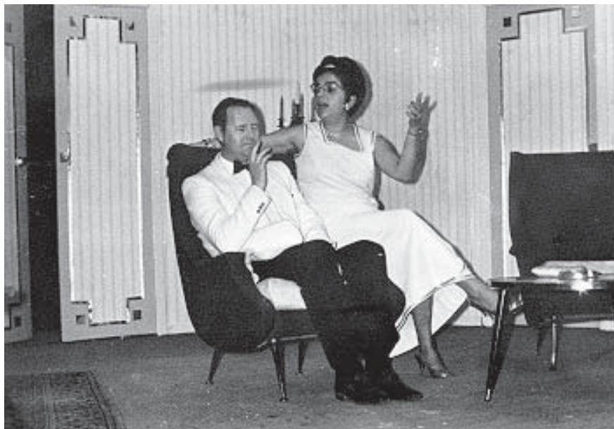
“Met dertien aan tafel”. De laatste productie in zaal Casino.