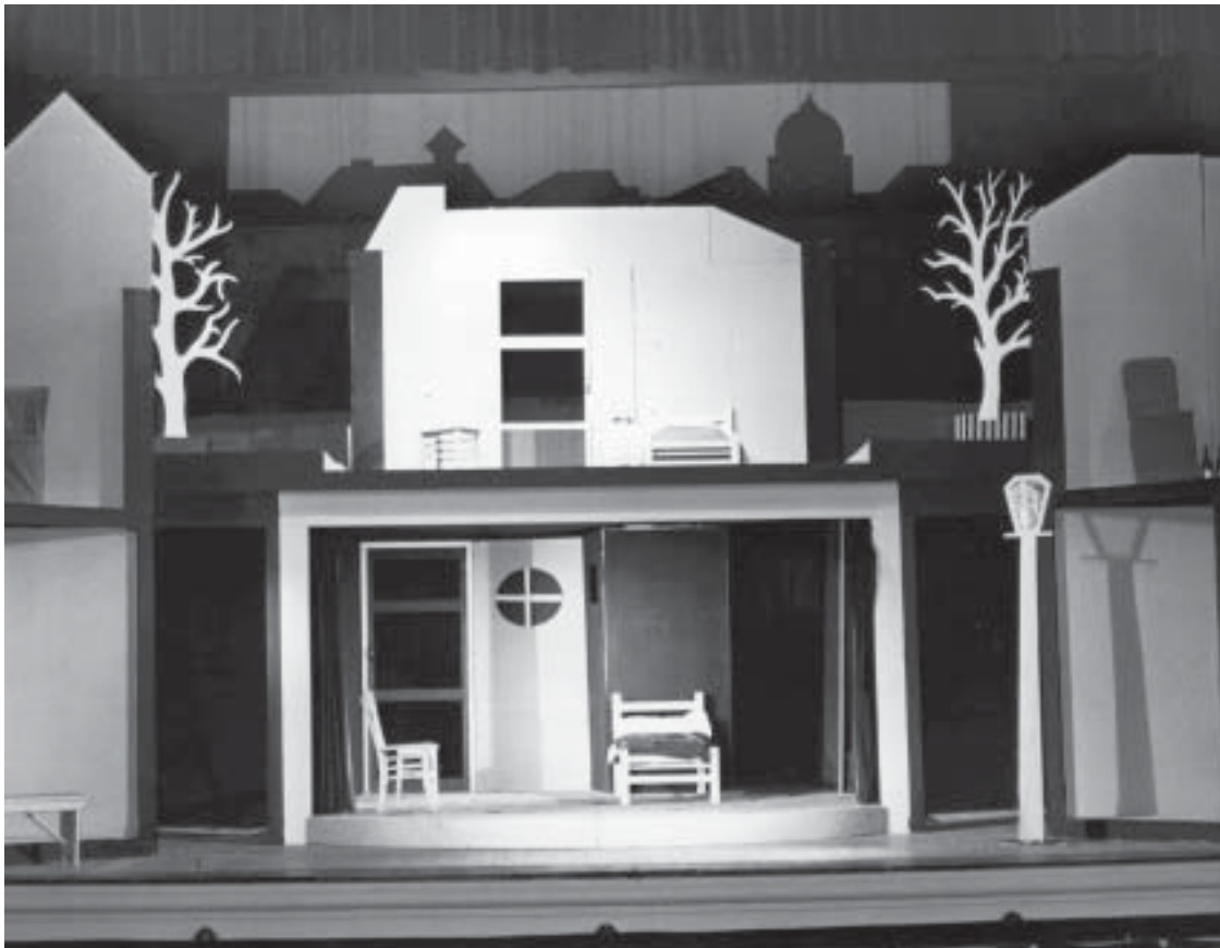
Onder: het monumentale decor van “Schuld en boete”.