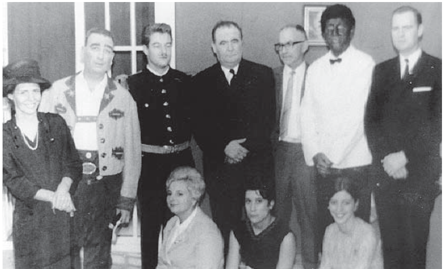
"Wat doen we met tante?"