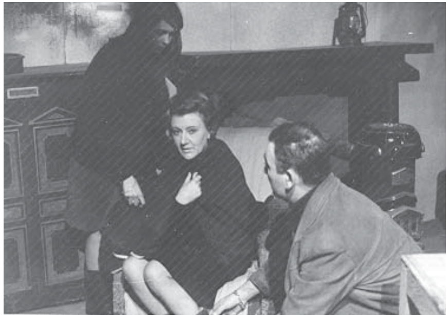
Twee actiebeelden uit "Het huis van de nacht".

Ook "De Ware Vrienden" stak telkens een handje toe met de opbouw van de decors.